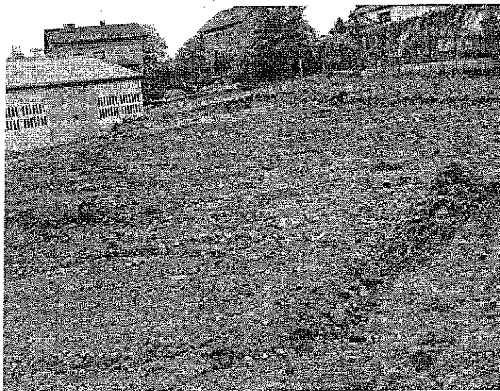
Zdj. nr 6 Teren przy Ośrodku Kultury w Skrzyszowie

Realizacja zadania wynika przede wszystkim z potrzeby społeczności lokalnej, a jej głównym celem jest budowa wiaty na terenie przylegającym do Ośrodka Kultury w Skrzyszowie.