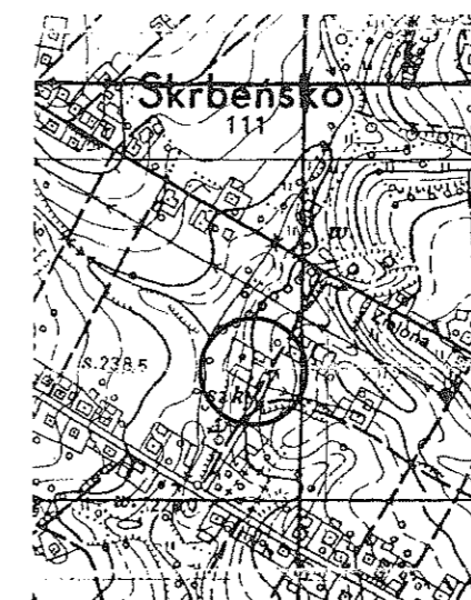
Szkic orientacyjny Skala 1:10000

Nie wyklucza się istnienia w terenie innych nie wykazanych na niniejszej mapie urządzeń podziemnych, które nie były zgłoszone do inwentaryzacji lub o których brak jest informacji w instytucjach branżowych