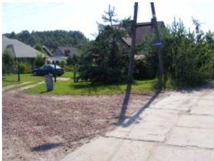
Zdj. 10 – ul. Piaskowa w Godowie