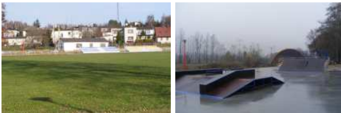
Zdj. 8, 9 Teren boiska LKS Olza Godów

Realizacja zadania wynika przede wszystkim z potrzeby społeczności lokalnej, a jej głównym celem jest budowa wiaty na terenie boiska LKS Olza Godów.