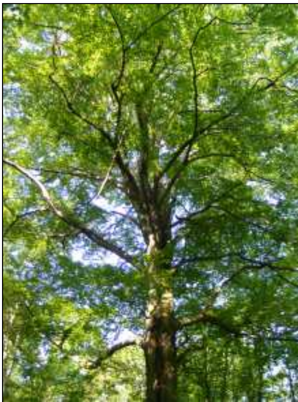
Zdj. 2 – Buk pospolity – pomnik przyrody

Na terenie Gminy znajduje się siedem szczególnie atrakcyjnych krajobrazowo i przyrodniczo terenów w formie użytków ekologicznych :