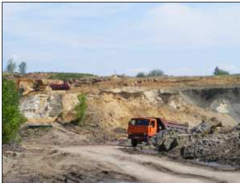
Zdj. 3 – Piaskownia

Sołectwa Skrzyszów i Krostoszowice należą do obszaru górniczego KWK „Jas – Mos” w Jastrzębiu Zdroju i KWK „Marcel” w Radlinie. 11