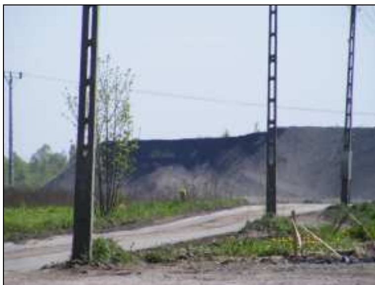
Zdj. 1 – Hałda w Skrzyszowie

W wielu tych wyrobiskach są tzw. stawiki. 7