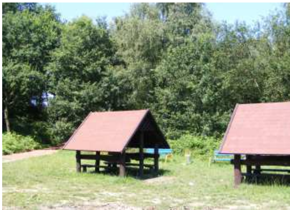
Zdj. 12 – Połączenie Polany Podgórnik z Piaskownią

Realizacja inwestycji wpłynie na wzrost atrakcyjności turystycznej tego obszaru, stworzy warunki do zaspokajania potrzeb mieszkańców wsi zwłaszcza potrzeb kulturalnych oraz pozytywnie wpłynie na promocję Godowa.