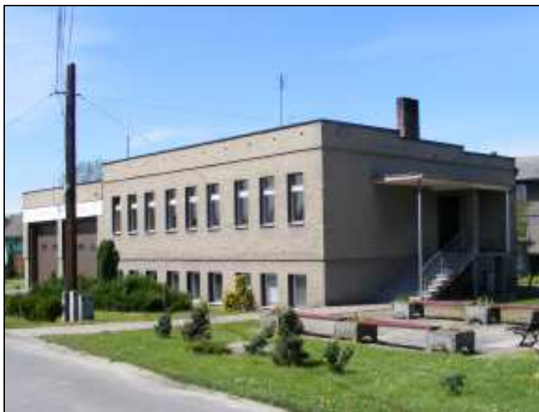
Zdj. 7 – Budynek OSP w Godowie

Na terenie sołectwa Godów działa od 1911r. Ochotnicza Straż Pożarna.