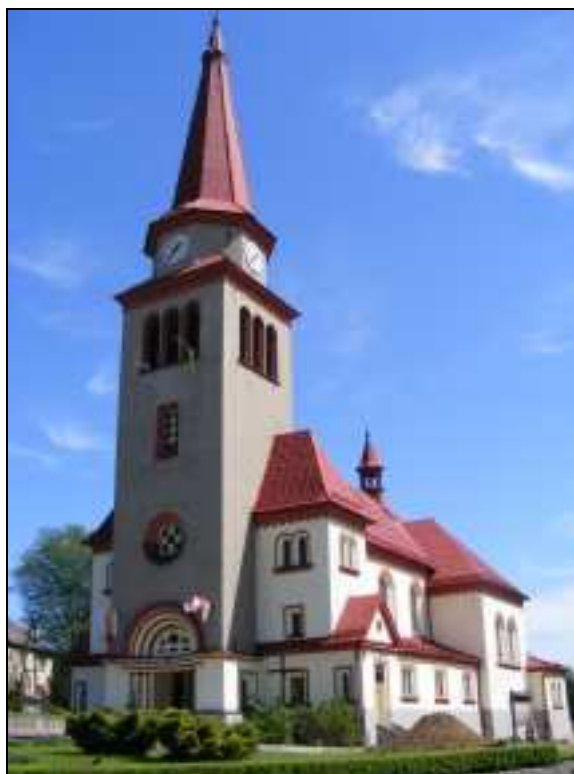
Zdj. 5 – Kościół pw. Św. Józefa Robotnika

W Godowie brak jest obiektów wpisanych do rejestru wojewódzkiego konserwatora zabytków.