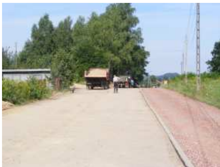
Zdj. 11 – ul. Piaskowa w Godowie

Tereny wokół Piaskowni są terenami atrakcyjnymi, o szczególnym znaczeniu dla nawiązywania kontaktów społecznych. Chętnie odwiedzane przez mieszkańców jak również przez mieszkańców pobliskich czeskich miejscowości. Oprócz kopalni piasku są tutaj przepiękne tereny leśne, polany. Teren osiedla Piaskowni jest połączeniem do polany zwanej Polaną Podgórną, jest doskonałym miejscem wypoczynku, na którym bardzo często