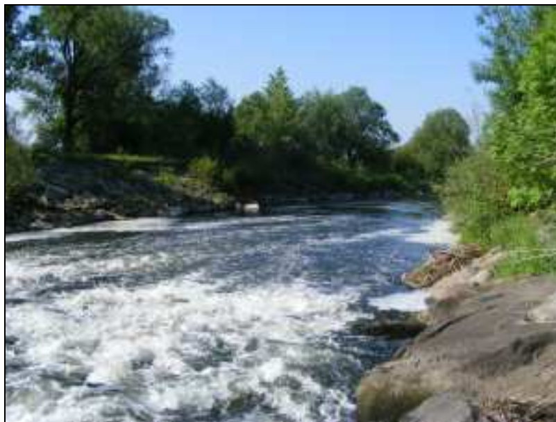
Zdj. 4 – Rzeka Leśnica

Rzeki nie mają prawidłowo oczyszczonych koryt rzecznych i nie są na całej długości uregulowane, co zwiększa niebezpieczeństwo powodzi i zalewania.