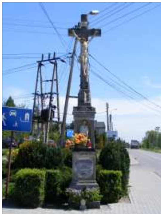
Zdj. 6 - Krzyż kamienny kapliczkowy z 1894r.

- kaplica Matki Boskiej ul.1-go Maja 124 na terenie ogrodu przydomowego z ok.1980r. 14