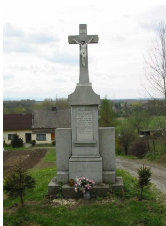
Zdj. nr 5 Krzyż przydrożny