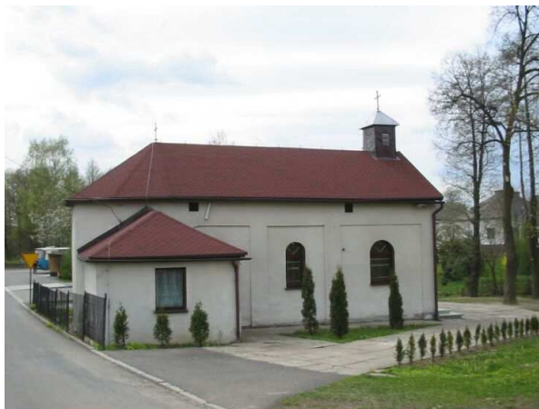
Zdj. nr 2 Kościół pn. Najświętszego Serca Pana Jezusa

W 1970 roku zostały wykonane nowe fundamenty pod rozbudowę kościoła. Rok 1973 stał się dla mieszkańców Skrbeńska czasem walki o kościół, a to za sprawą trudności jakie napotykali podczas rozbudowy świątyni. Prace były wykonywane bez żadnej dokumentacji, przewidywano bowiem że zezwolenie i tak nie zostanie wydane. W czerwcu na teren budowy przyjechała milicja, prokurator, wojewoda i przewodniczący władz powiatowych. Polecenie władz brzmiało jednoznacznie: wszystko, co zostało wybudowane należy zburzyć a potem starać się o zezwolenie na budowę. Widząc jednak bezskuteczność oporu zaproszono architekta, który wykonał potrzebną dokumentację. Została ona zatwierdzona przez Powiatową Radę Narodową i rozbudowa ruszyła dalej. W ciągu dwóch tygodni wzniesiono mury, położono dach i postawiono wieżę. Jesienią przywieziono drewno na chór i wykonano schody oraz balustradę.