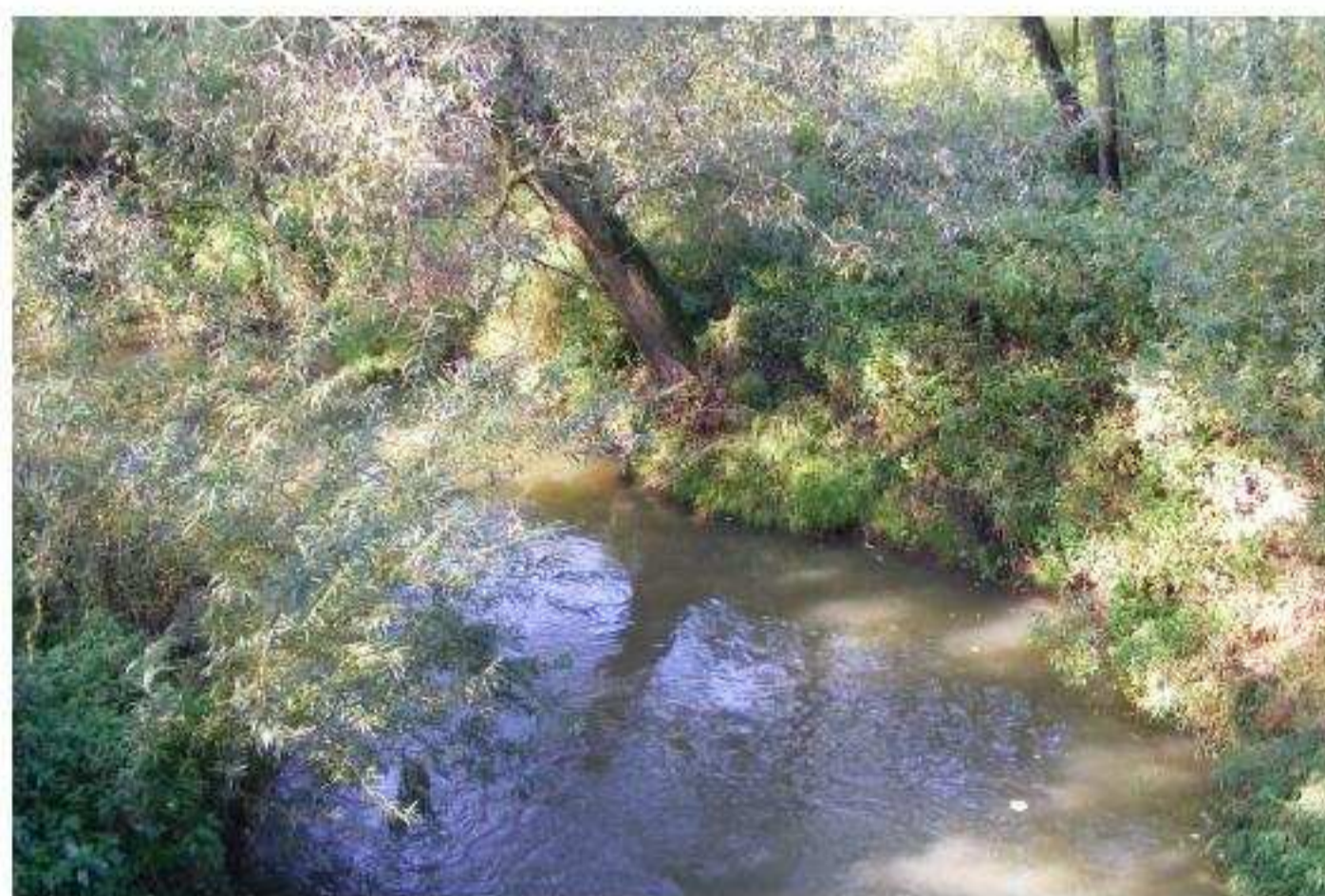
Zdjęcie nr 4 – Rzeka Piotrówka

Gmina Godów położona jest w zlewni rzeki Olzy prawobrzeżnego dopływu Odry. Piotrówka będąca prawobrzeżnym dopływem Olzy ma swój początek w Czechach na odcinku ok. 6km jest rzeką graniczną, a przepływa przez sołectwa Skrbeńsko, Gołkowice, Godów. Szotkówka, też będąca prawobrzeżnym dopływem Olzy, przepływa wraz ze swoim prawobrzeżnym dopływem Leśnicą przez sołectwa Gołkowice i Godów.