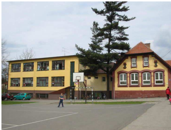
Zdj. nr 1 Zespół Szkolno-Przedszkolny w Skrzeńsku

Obecnie funkcjonuje Zespół Szkolno-Przedszkolny, którego dyrektorem została Jolanta Ucherek.