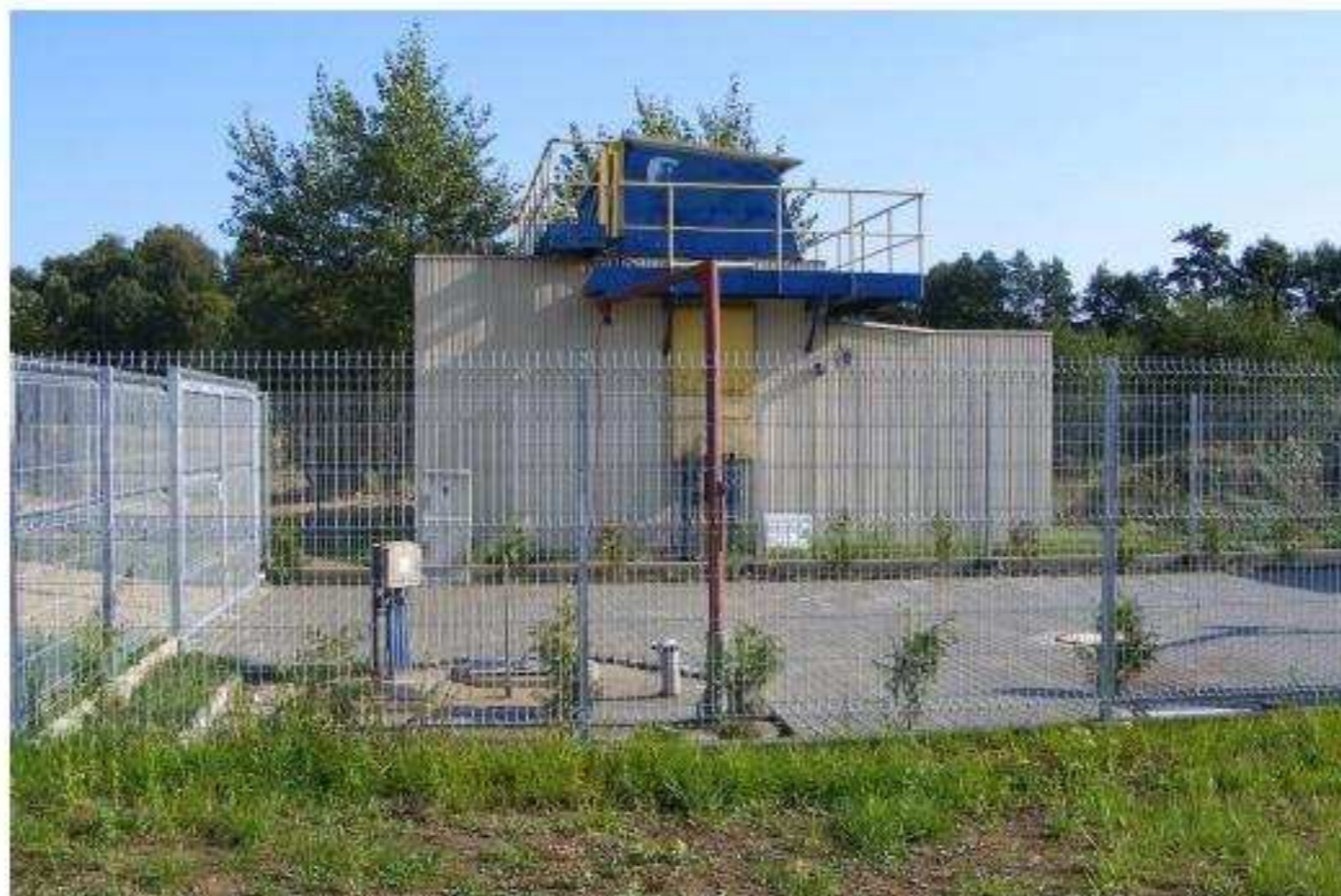
Zdj. nr 8 – oczyszczalnia ścieków

Na terenie Gminy znajduje się kontenerowa oczyszczalnia ścieków wybudowana w 1998r. o przepustowości 63m 3 na dobę. Oczyszczalnia ta znajduje się w Gołkowicach i odprowadza ścieki z części sołectwa Gołkowice.