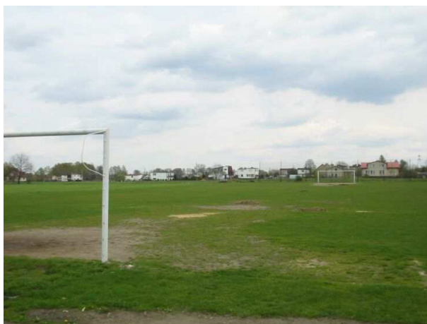
Zdj. nr 10 – Teren boiska KS-27 Gołkowice

Realizacja zadania wynika przede wszystkim z potrzeby społeczności lokalnej, a jej głównym celem jest budowa wiaty na terenie boiska KS-27 Gołkowice.