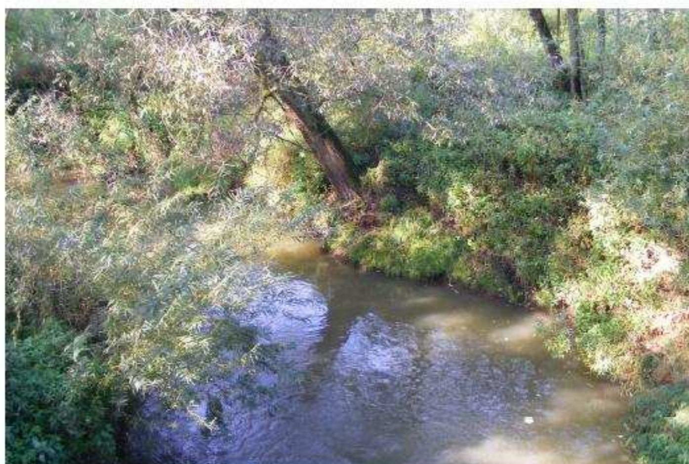
Zdj. nr 4 – Rzeka Piotronka w Golkowicach

Rzeki nie mają prawidłowo oczyszczonych koryt rzecznych i nie są na całej długości uregulowane co zwiększa niebezpieczeństwo powodzi i zalewania.