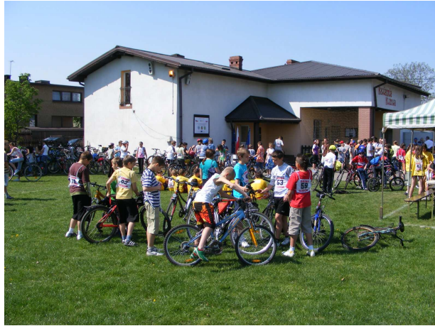
Zdj. nr 9 Teren boiska KS-27 Gólkowice