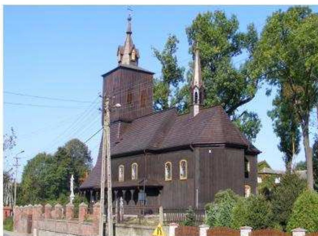
Zdj. nr 5,6,7 – Kościół pw. Św. Anny

Wieś Golkowice zlokalizowana jest wzdłuż drogi z Jastrzębia w kierunku Raciborza wzdłuż granicy Państwa. Główną osią wsi jest obecna ulica 1 Maja.