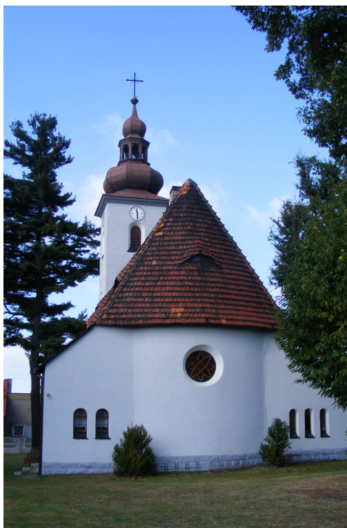
Zdj. nr 2 – Kościół ewangelicko-augsburski w Gólkowicach

W 1985 pod kierunkiem cieszyńskiego artysty Jana Hermy przebudowano ołtarz, zawieszając duży krucyfiks.