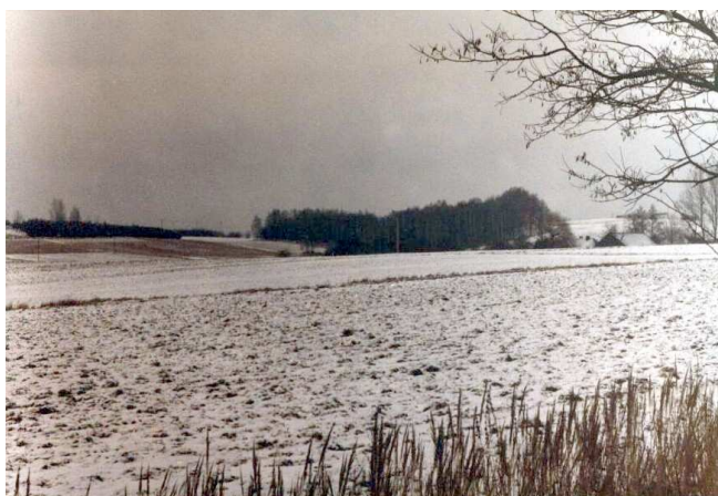
Zdj. Nr 3 - Jar w Gólkowicach

Drzewostan stanowią w większości drzewa iglaste – sosna.