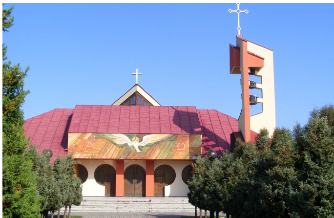
Zdj. nr 1 – Kościół pw. Podwyższenia Krzyża Św. W Gołkowicach