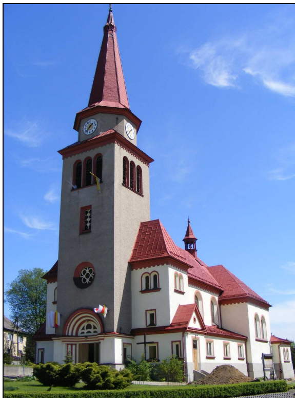
Zdj. 5 – Kościół pw. Św. Józefa Robotnika

W Godowie brak jest obiektów wpisanych do rejestru wojewódzkiego konserwatora zabytków.