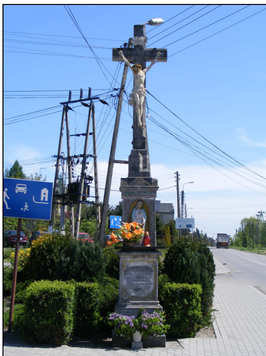
Zdj. 6 - Krzyż kamienny kapliczkowy z 1894r.

- kaplica Matki Boskiej ul.1-go Maja 124 na terenie ogrodu przydomowego z ok.1980r. 14