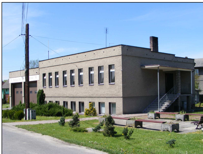
Zdj. 7 – Budynek OSP w Godowie

Na terenie sołectwa Godów działa od 1911r. Ochotnicza Straż Pożarna.