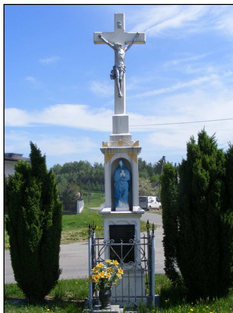
Zdj. 5 – Krzyż kamienny kapliczkowy z 1880r. na skrzyżowaniu ulic: 1-go Maja, Przedszkolnej, Polnej, Jana III Sobieskiego