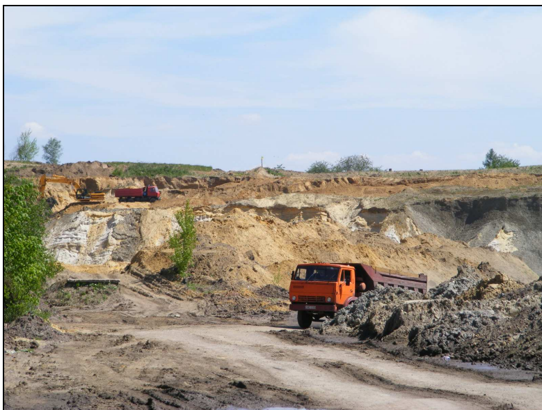
Zdj. 3 – Piaskownia

Na terenie całej gminy występują surowce skalne takie jak piasek, żwir i ily. W okolicach Godowa zlokalizowana jest kopalnia piasku.