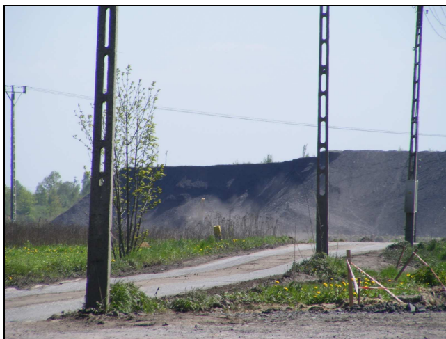
Zdj. 1 – Hałda w Skrzyszowie

Gmina ma duży wskaźnik nieużytków i tzw. innych gruntów, co jest wynikiem występowania dużych wyrobisk, składowisk pogórnictwa i przemysłowych, zapadlak górnictwa. W wielu tych wyrobiskach są tzw. stawiki. 6