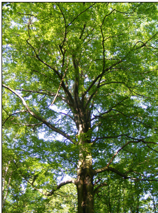
Zdj. 2 – Buk pospolity – pomnik przyrody

Na terenie Gminy znajduje się siedem szczególnie atrakcyjnych krajobrazowo i przyrodniczo terenów w formie użytków ekologicznych: