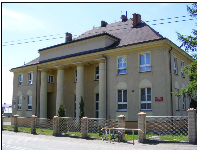
Zdj. 6 – Budynek Szkoły Podstawowej w Łaziskach