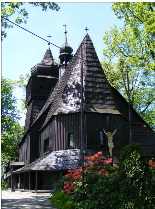
Zdj. 5 – Kościół pw. Wszystkich Świętych

W Łaziskach można wyróżnić dwie otwarte przestrzenie wspólne tzw. dominanty przestrzenne: kościół parafialny pod wezwaniem Wszystkich Świętych i wzgórze z Kalwarią jako dominantę krajobrazową z najpiękniejszymi widokami na całą okolicę Olzy w kierunku Beskidów.