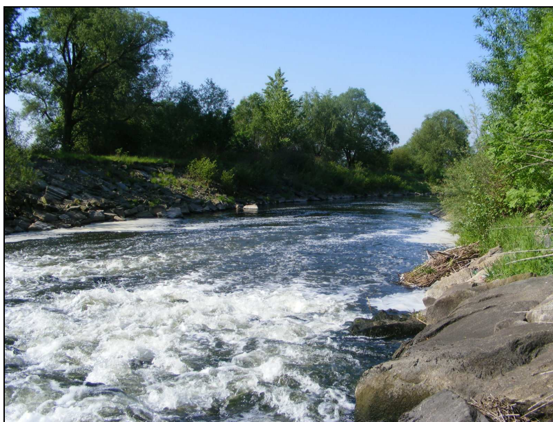
Zdj. 4 – Rzeka Leśnica

Gmina Godów położona jest w zlewni rzeki Olzy prawobrzeżnego dopływu Odry. Piotrówka będąca prawobrzeżnym dopływem Olzy ma swój początek w Czechach na odcinku ok. 6km jest rzeką graniczną, a przepływa przez solectwa Skrbeńsko, Gołkowice, Godów. Szotkówka, też będąca prawobrzeżnym dopływem Olzy, przepływa wraz ze swoim prawobrzeżnym dopływem Leśnicą przez solectwa Gołkowice i Godów.